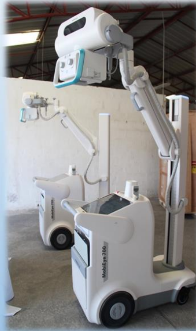
2 UNIDADES DE RX DIGITAL MÓVIL BÁSICO, PARA USO GENERAL