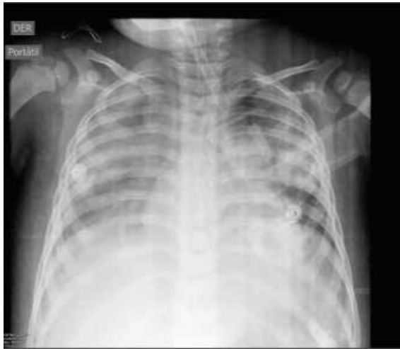
Figura 2: Rx de tórax con presencia de velamiento bilateral de campos pulmonares.

por deterioro del cuadro respiratorio se decide su pase a la Unidad de Cuidados Intensivos Pediátricos para manejo avanzado de vía aérea, abordado como Insuficiencia Respiratoria secundaria a Neumonía adquirida en la comunidad. (figura 2)