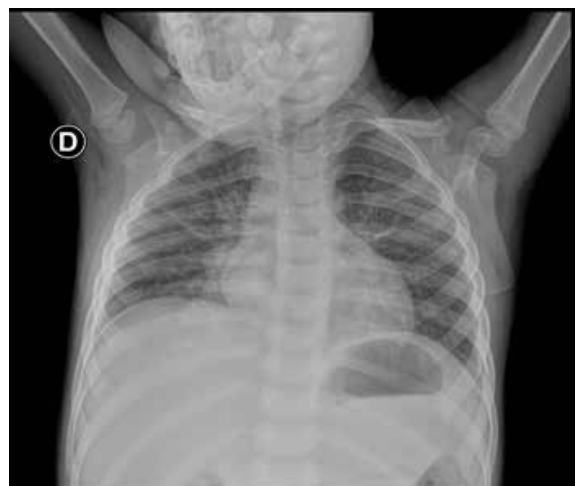
Figura 3. Rx de tórax con franca mejoría de patrón radiológico

En cuanto a su cobertura infecciosa se reportó hemocultivos por dos, positivos al ingreso con Streptococcus pneumoniae , para lo cual se trató 21 días con Cefepime. El paciente cursó 19 días en Cuidados Intensivos, para luego continuar su manejo en sala de hospitalización donde culminó con esquema antibiótico de amplio espectro, evidenciándose mejoría en su parte clínica, exámenes de laboratorio y en nuevas imágenes previo al alta. A su egreso realizó control por consulta externa de Nefrología para evaluar función renal la misma que se recuperó totalmente al igual que por Neumología, siendo dado de alta por ambos servicios dada la recuperación completa de la parte renal y pulmonar (figura 3).