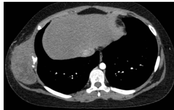
Figura 3: TAC de tórax y abdomen sin metástasis

Masa costotorácica de 8.7x4.6 cm con destrucción de la octava costilla dorsal. Estructura heterogénea con áreas de necrosis central y compromiso muscular intercostal.